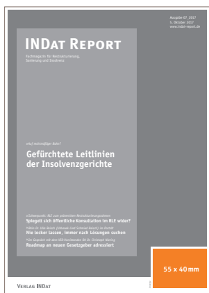
U1 Titelanzeige 55 x 40 mm