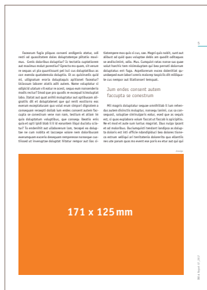
1/2 Seite quer 171 x 125 mm