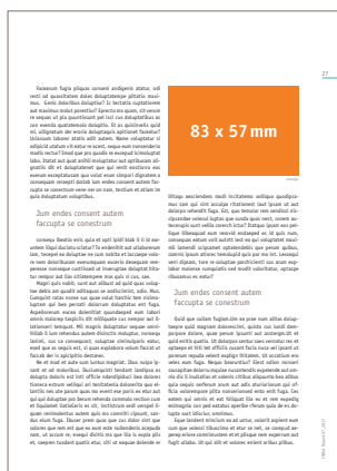
1/8 Seite quer 83 x 57 mm