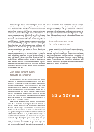
1/4 Seite hoch 83 x 127 mm