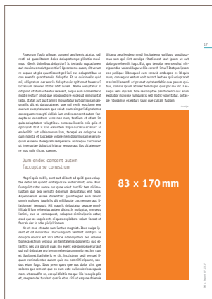
1/2 Seite hoch 83 x 170 mm